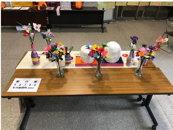
愛の家GH 牛川薬師町(豊橋市)