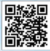
参加申し込み用 二次元コード

ホームページにアクセスいただき、「申し込みフォーム」よりお申し込みください。 ホームページ ▶ https://www.npwo.or.jp/info/26313 右の二次元コードからもお申し込みが可能です。