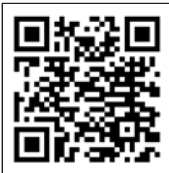
参加申し込み用 二次元コード